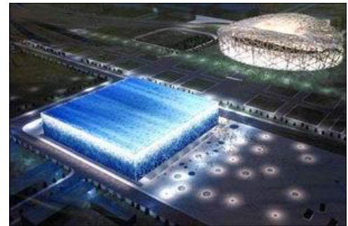
Svømmearenaen - Water Cube